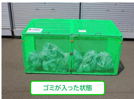
ゴミが入った状態