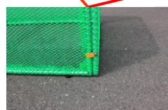
【正面パネル】 湾曲からL型へ 全サイズ